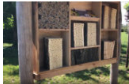
Wildbienenhotel in Eigenbauweise